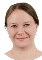
Mette Wigand Bode Formand for Erhvervs- og Arbejdsmarkedsudvalget